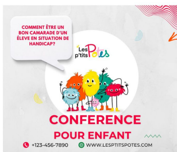
Des conférences pour enfant